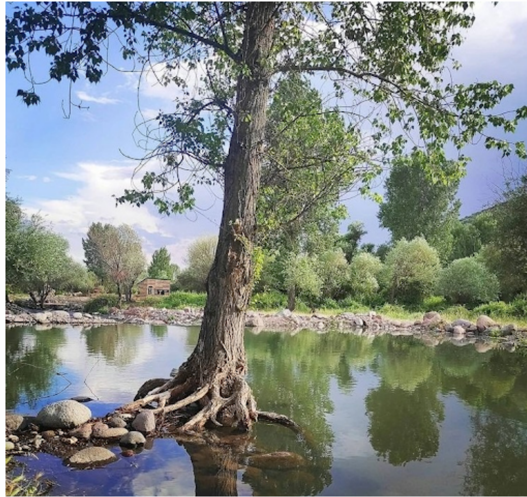
Süvari Çayı, Tahtaciörencik Köyü