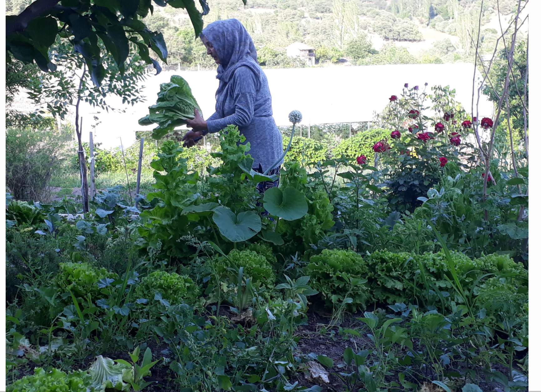
Kolektiften bir ailenin bahesi